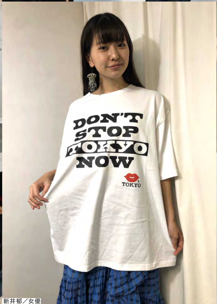
新井郁 / 女優