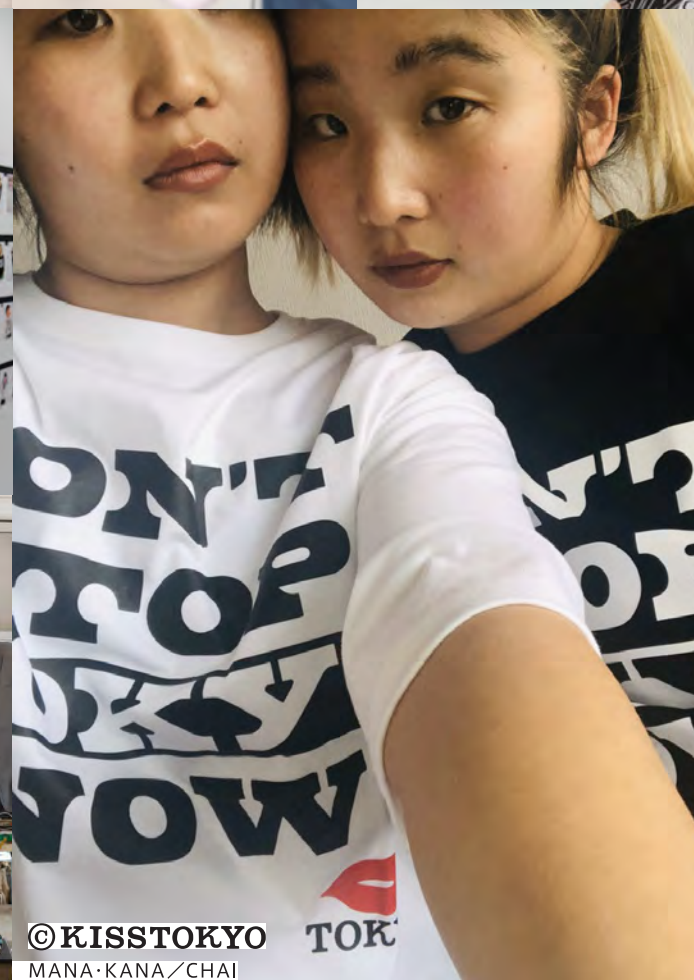
© KISSTOKYO TOKYO MANA・KANA / CHAI