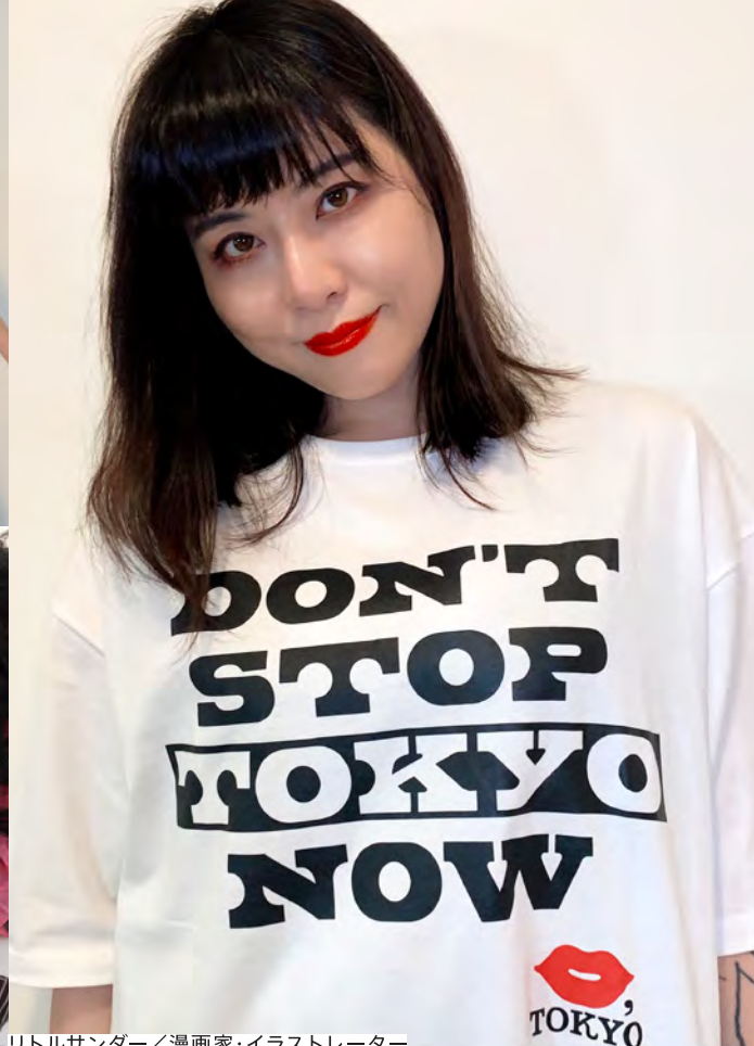
リトルサンダー / 漫画家・イラストレーター