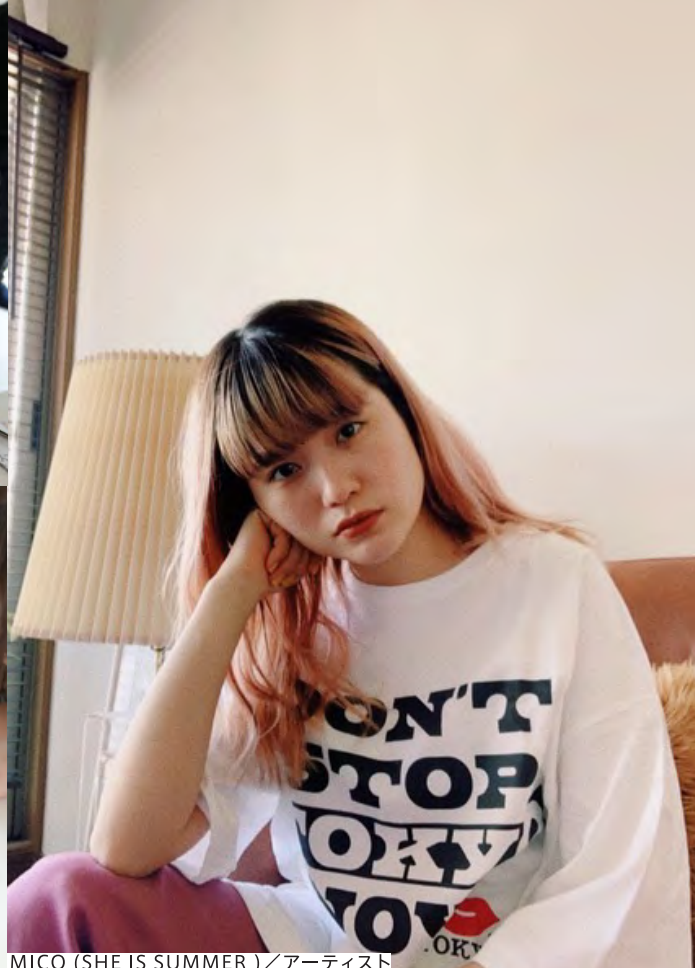
MICO (SHE IS SUMMER) / アーティスト