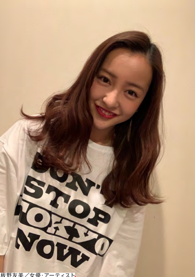
板野友美 / 女優・アーティスト